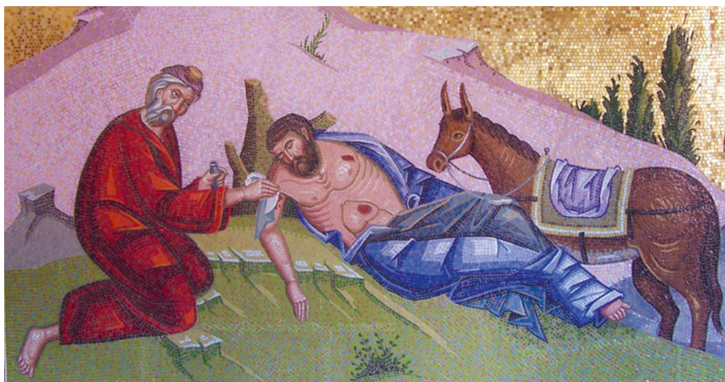
Passend zur Jahreslosung «Der barmherzige Samariter»