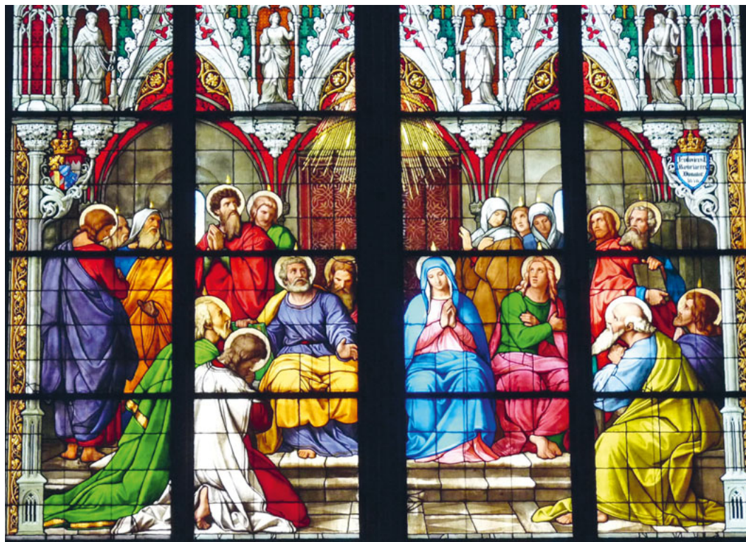
Das Mittelteil eines Fensters im Kölner Dom, mit der Herabkunft des Heiligen Geistes an Pfingsten.

Mittwoch, 12. Mai, 14 Uhr: Jonglieren (lernen) in der Turnhalle in Montlingen Freitag, 4. Juni, 19.30 Uhr: Beobachtung der Fledermäuse an der Kirche in Eichberg